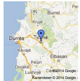
Tirana, Albanien auf einer größeren Karte anzeigen

Bekannt ist Petrela insbesondere wegen seiner Burg, die im 15. Jahrhundert Teil des Verteidigungssystems des albanischen Fürsten Skanderbegs war. Die in der frühbyzantinischen Zeit errichtete Festung „Petrela“ wurde im 15. Jahrhundert einige Zeit von Skanderbegs Schwester Mamica Kastrioti gegen die Osmanen verteidigt. Die Burg liegt auf einem spitzen Berg westlich des Dorfes, das ganze Erzen-Tal überblickend. Von hier aus wurden die Verkehrswege über den „Krraba-Pass“ kontrolliert. Die ersten Befestigungen stammen wahrscheinlich aus dem 3. Jahrhundert. Im 9. Jahrhundert wurde die Anlage ausgebaut und diente den zahlreichen lokalen Herrschern Mittelalbaniens als Stützpunkt. Später kam noch eine äußere Umfassungsmauer hinzu, die die eher kleine, aber wehrhafte Burg auf der Spitze absicherte. Auf einem Turm der Burg wurde um das Jahr 2000 ein Restaurant gebaut. Durch die Aufbauten wurde die historische Bausubstanz stark verändert. Restaurant und Burg bringen Besucher aus Tirana ins Dorf.